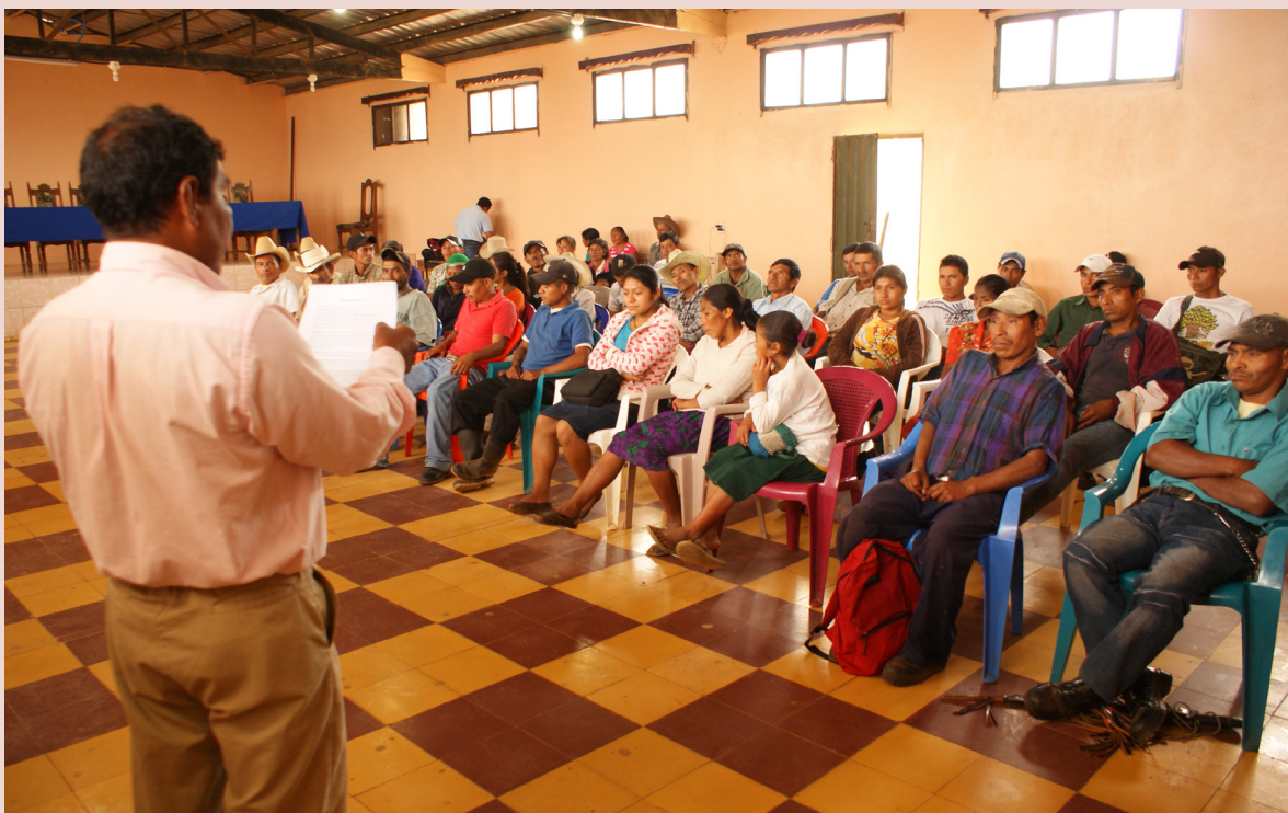
El Vice Alcalde de Yarula socializa con beneficiarios el reglamento del Fondo para la Erradicación del Hambre.